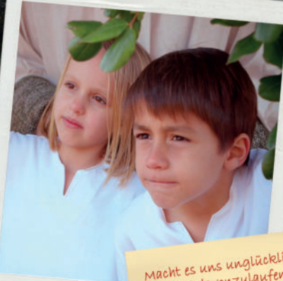
Adam und Eva Der Gott, dem wir in der Bibel begegnen ist ein guter Vater, der um seine Kinder kämpft, wenn sie sich von ihm abwenden.

Macht es uns unglücklich vor Gott davonzulaufen?