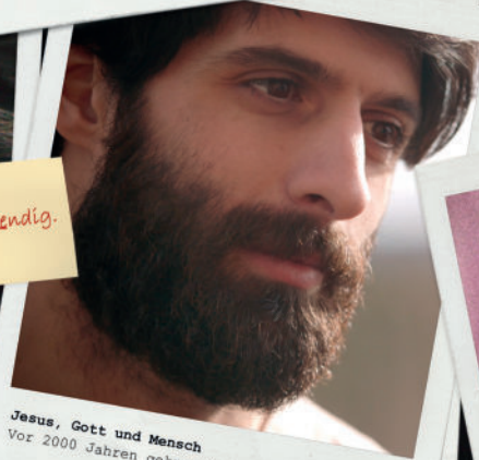
Jesus, Gott und Mensch Vor 2000 Jahren gekreuzigt.